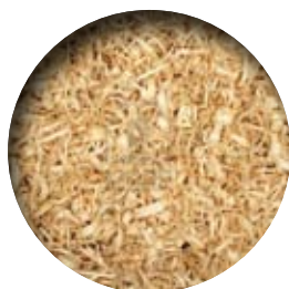
FILTRO DE VIRUTA DE MADERA WOOD FIBER FILTER FILTRE DE FIBRE DE BOIS