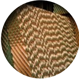
FILTRO DE CELULOSA. NIDO DE ABEJA CELLULOSE COOLING PAD. HONEYCOMB PANNEAU DE CELLULOSE. NID D'ABEILLE mm=100