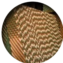
FILTRO DE CELULOSA. NIDO DE ABEJA CELLULOSE COOLING PAD. HONEYCOMB PANNEAU DE CELLULOSE. NID D'ABEILLE

GSK 100 SERIES. VERTICAL SERIES (Top outlet) · SÉRIE GSK 100. SÉRIE VERTICALE (Sortie par le haut)